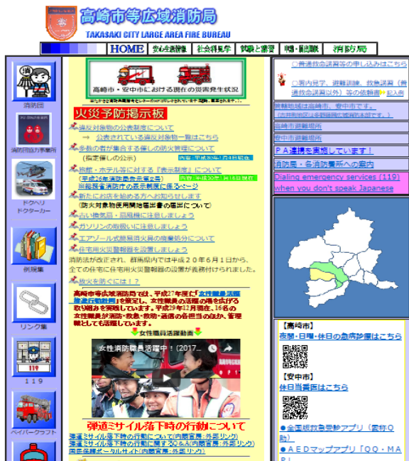
消防局ホームページ（トップページ）

インターネット利用者の増加など、高度情報化の進展を踏まえ、平成13年12月からホームページを開設し、防火・防災情報を発信しています。