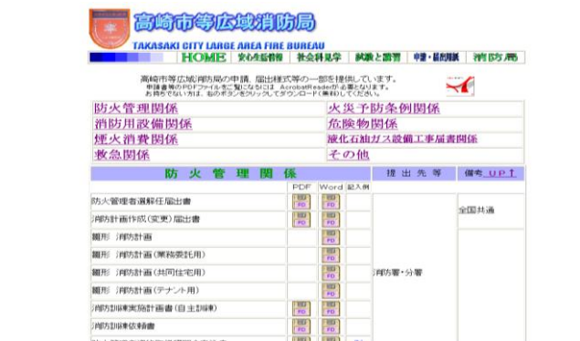
申請書・届出書ダウンロードのページ