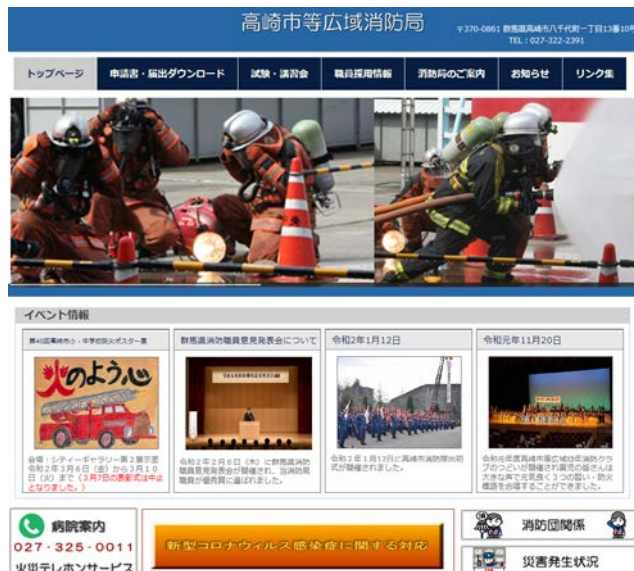
消防局ホームページ（トップページ）

令和2年3月、消防局ホームページを一新し、活動状況、各種行事および防災情報等を発信しています。