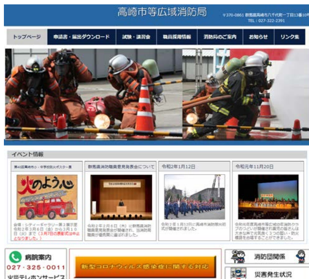
消防局ホームページ（トップページ）

令和2年3月、消防局ホームページを一新し、活動状況、各種行事および防災情報等を発信しています。